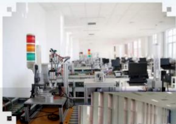
自动化生产线安装与 调试训练场所